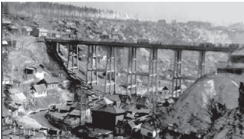
Мост через р. Каменку, 1930 г.

Вода в К. была очень мутная, в черте города к тому же загрязнена бытовыми и производственными отбросами, но для технических и противопожарных целей вода