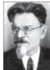
М. И. Калинин