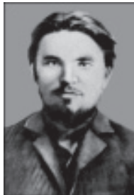
С. М. Киров

В соотв. с пост. Президиума ВЦИК от 20.10.1930 был образован Заобский р-н. В гор. черту включены населен. пункты: Большое Кривошеково , с. Бугры, деревни: Вертоково , Ерестная , Перево , Малое Кривошеково , Усть-Иня , с.-х. опытная станция и внеусадебные земли селений Каменское и селхозкомунны им. Сырцова. Центром р-на стало Большое Кривошеково. Р-н занимал площадь 143 кв. км. Нас. составляло 45 тыс. чел. 2.12.1934 Пост. Президиума Новосибир. гор. Совета Заобский р-н переименован в Кировский. Важнейшим этапом развития Левобережья стали годы Вел. Отеч. войны. В годы войны выдали первую продукцию «Тяжстанкогидропресс», олово-завод . В нач. 1950-х на пустырях К.р. развернулось стр-во пром. объектов. В 1950 начал строиться один из самых крупных ныне в стране предпр. электротехн. пром-сти з-д «Сибэлектротяжмаш» (турбогене-