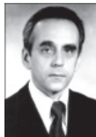
Г. Я. Княжев

КНЯЖЕВ Гелий Яковлевич (р. 29.3.1932, Москва), зам. начальника Центрального конструкторского бюро точного приборостроения по спец. технике (1972–1998), лауреат Ленинской пр. (1978), засл. конструктор РФ (2000).