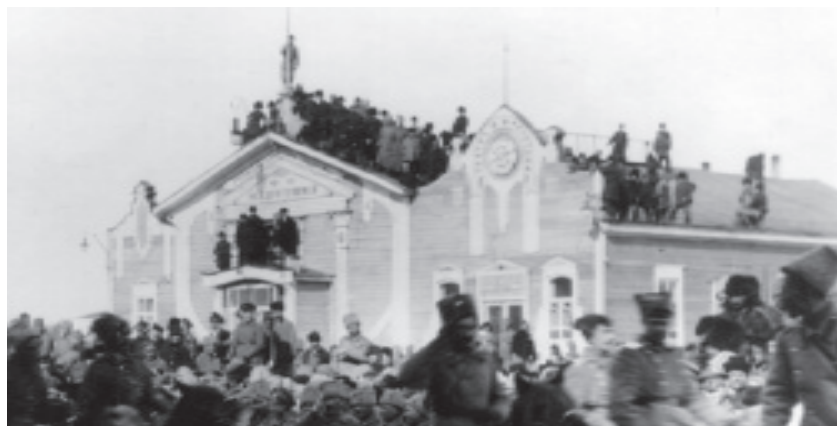
Митинг у здания кинотеатра Ф. Ф. Махотина на Николаевском проспекте, 1917 г.

Ежегодно на киноустановки обл. выдавалось до 100 тыс. программ игровых фильмов и более 160 тыс. программ документ. и научно-популярного кино.