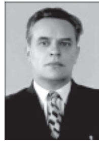
В. П. Казаринов

При активном участии К. созданы сиб. филиалы Всесоюз. нефтяного науч.-исслед. геологоразвед. ин-та Мин-ва геологии СССР (ВНИГРИ), Всесоюзного НИИ геофизики (ВНИИгеофизика), в 1956 организован в Новосибир. 1-й в Сибири НИИ геологии, геофизики и минерального сырья (СНИГТИМС). К. организовал и до конца